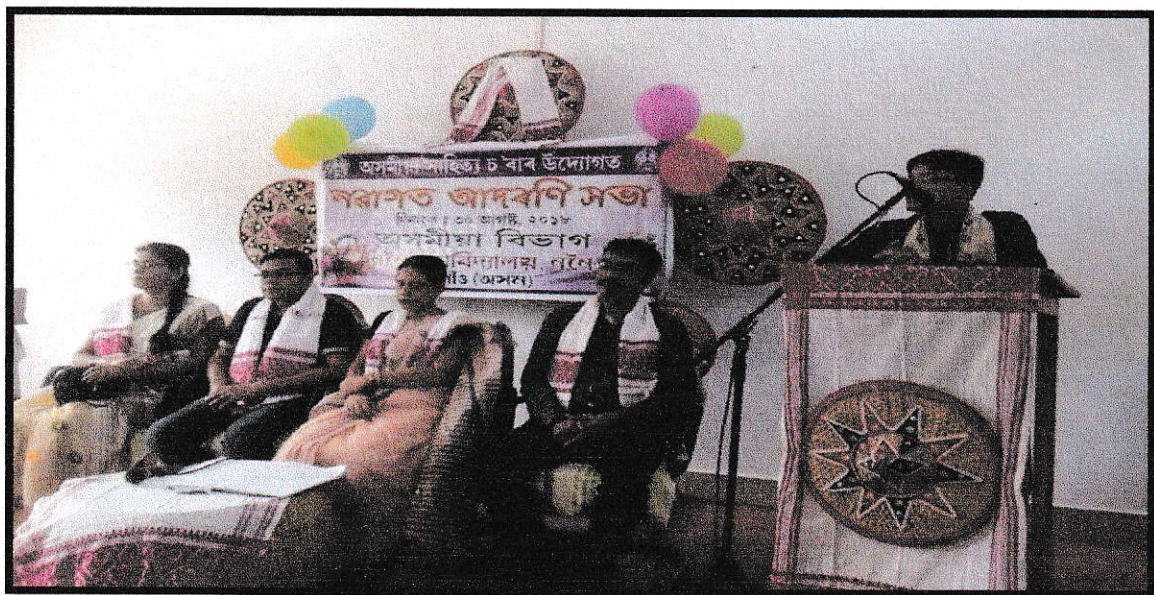
Meeting of Freshman Social