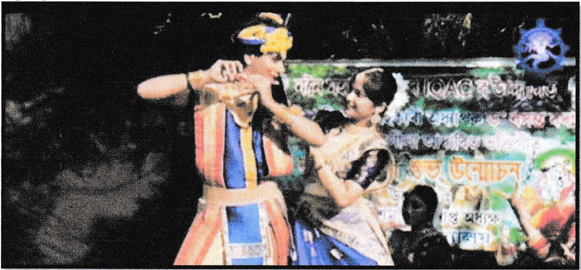
KRISHNA KANAI-3 INNOGORATION